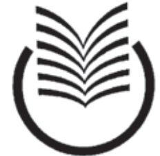
Signet Gefangenenbüchereien in NRW (Grafik: Willuhn 1994)

Die Gefangenenbücherei der JVA Münster wurde mit dem Deutschen Bibliothekspreis als die „Bibliothek des Jahres 2007“ ausgezeichnet. Ihr Beispiel gibt Einblicke in die Praxis der Bibliotheksarbeit im Justizvollzug in Deutschland aus der Erfahrung in Nordrhein-Westfalen. Den Leser mag dieser Beitrag zu Projekten der sozialen Bibliotheksarbeit anregen, auf den neuen Förderverein Gefangenenbüchereien e.V. aufmerksam machen und zum Blick in den Spiegel eines Mikrokosmos unserer Gesellschaft sensibilisieren.