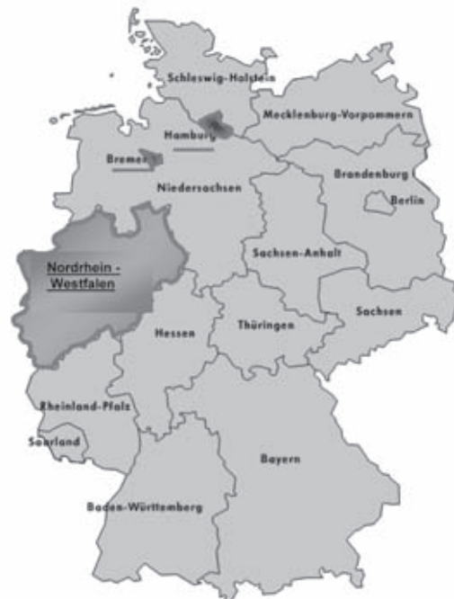
Abb. 1: Drei Bundesländer mit hauptamtlich tätigen Bibliothekaren im Justizvollzug in Deutschland

die in zahlreichen Beiträgen einen aktuellen Überblick zu verschiedenen Bereichen der sozialen Bibliotheksarbeit gibt 6 .