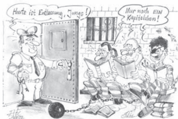
Abb. 9: Karikatur in den Westfälischen Nachrichten zur „Bibliothek des Jahres 2007“. (Karikatur: Zinkant, Münster 2007)

2007 wurde laut Mitteilung von Vibeke Lehmann auf der IFLA-Konferenz in Südafrika eine Plakataktion geplant, in welche die Gefangenenbücherei der JVA Münster als „Bibliothek des Jahres 2007“ in Deutschland auf einem gesonderten Plakat integriert werden soll.