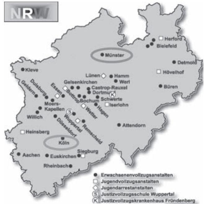
Abb. 2: Jugendarrest- und Justizvollzugsanstalten im Land Nordrhein-Westfalen

In den Vollzugsanstalten in Nordrhein-Westfalen bestehen rund 60 anstaltsinterne Büchereien von 1 000 bis 12 000 Medieneinheiten mit einem derzeitigen Gesamtbestand von ca. 240 000 Medieneinheiten.