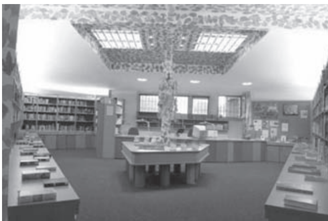
Abb. 7: Blick in die Gefangenenbücherei

Sowohl die Erneuerung der Gefangenenbücherei als auch die Integration der Fachstelle Gefangenenbüchereiwesen in die JVA Münster und die damit verbundene Leitung der Gefangenenbücherei durch den hier tätigen Dipl.-Bibliothekar wirken nachhaltig.