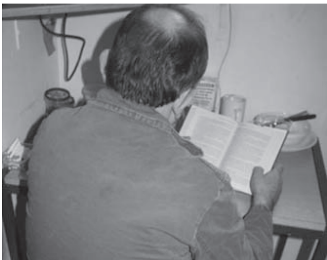
Abb. 8: Leser im Haftraum