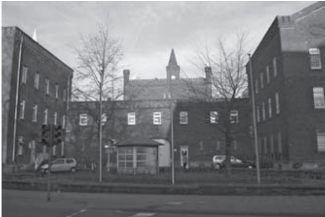
Abb. 5: JVA Münster: Aussenpforte