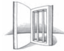
„Gefangenenbücherei“ (Grafik: Herfurth 2007)