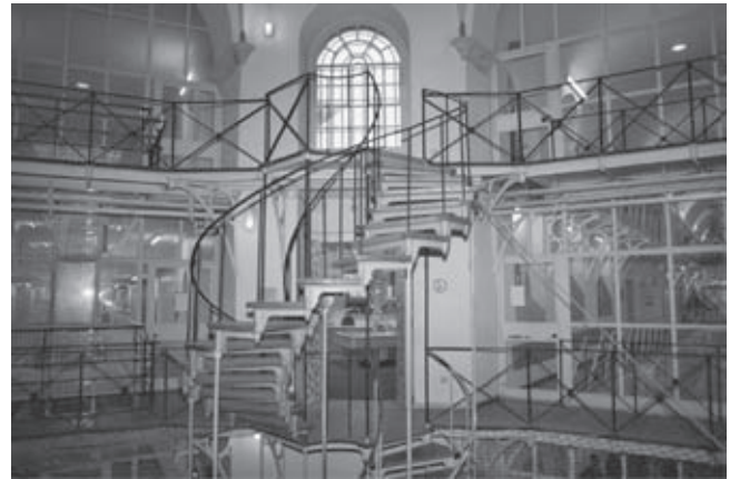
Abb. 6: Bücherei im Zentrum der JVA Münster zwischen zwei Haftraumflügeln

lungs- und anstaltsübergreifender kollegialer Solidarität und Kooperation sowie externer Unterstützung. Gleichwohl sind „Bibliotheken in Vollzugsanstalten ein wichtiges Instrument der Resozialisierung“ 17 .